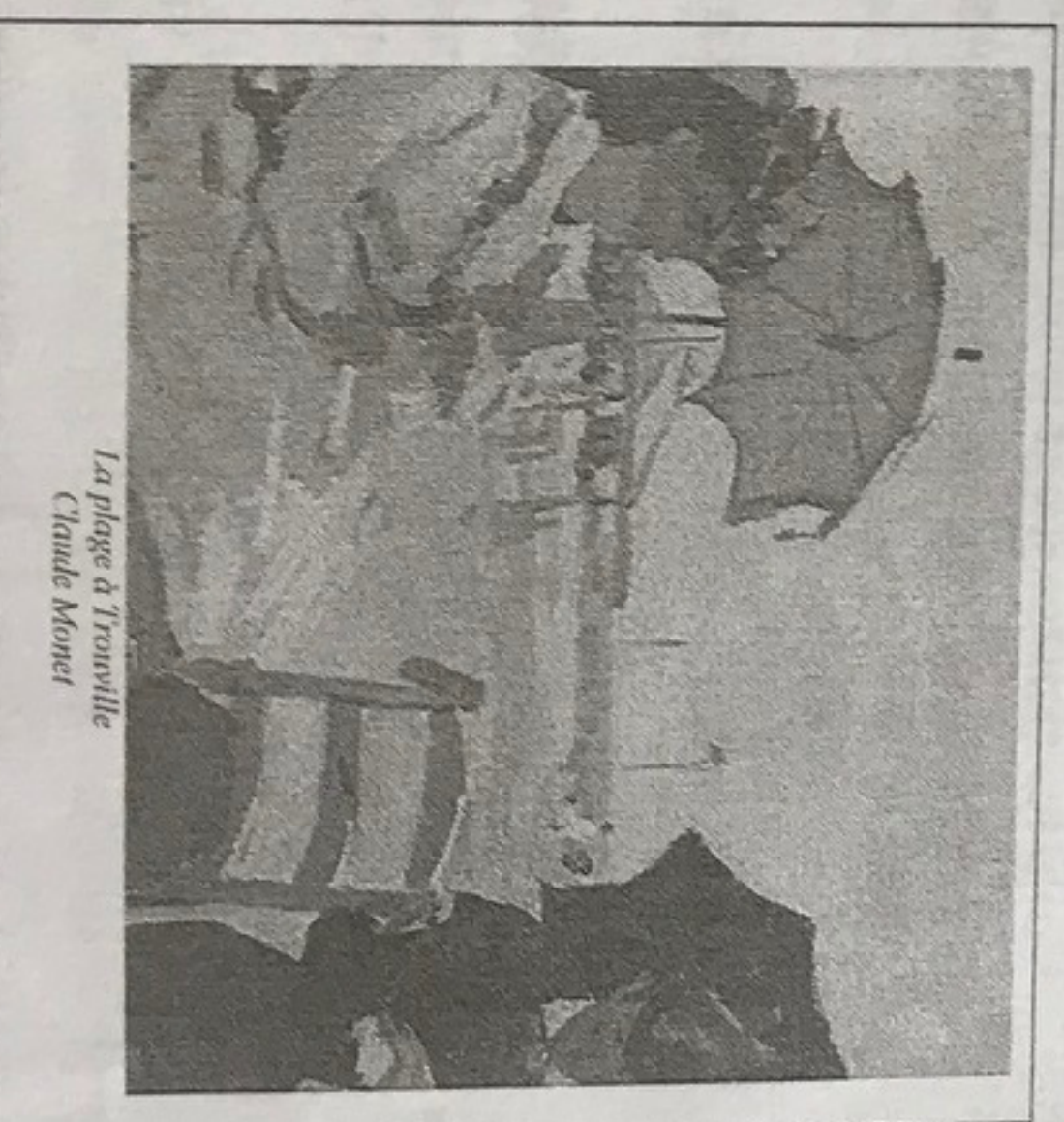
La plage à Trouville Claude Monet