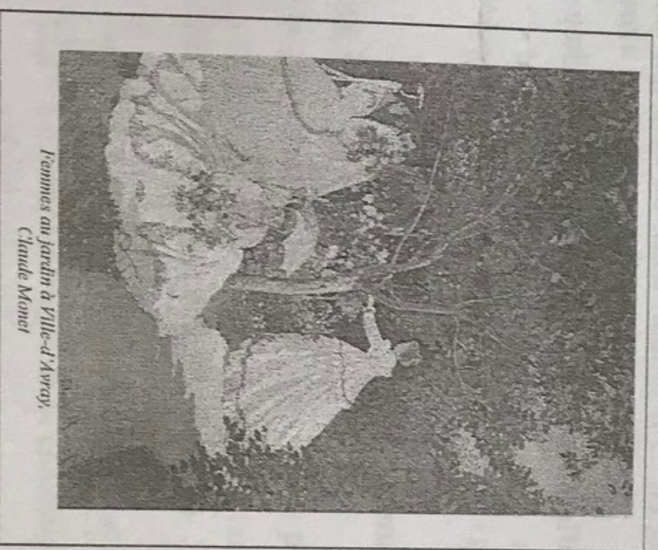
Femmes au jardin à Ville-d'Avray, Claude Monet